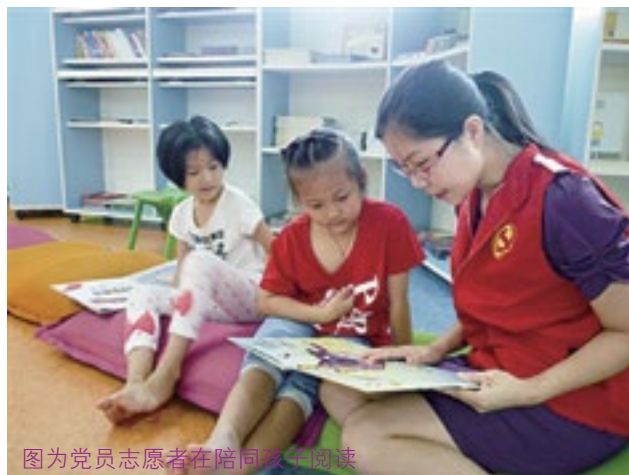
图为党员志愿者在陪同孩子阅读

据悉，所捐书款将用于横岗“爱子乐阅读馆”购买书籍之用，以满足辖区内的孩子的阅读需求。（党支部 供稿）