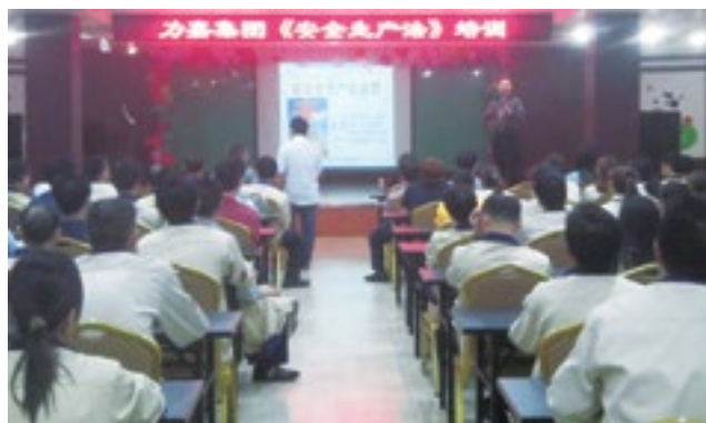
上图为3月19日在产业园举办的《新安全法》培训现场