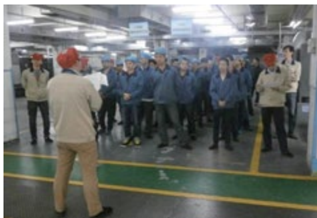
上图为3月24日印刷部在车间进行《新安全法》培训时的场景